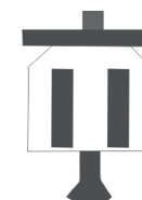
Item - D Parador Veneza