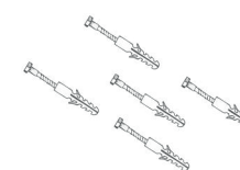
Item - G Parafuso com Buchas